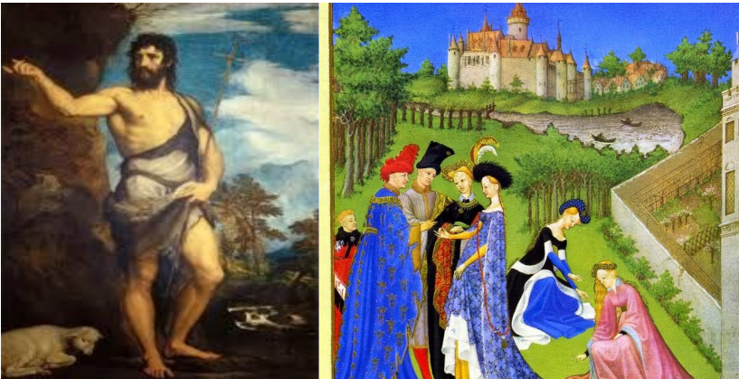
Imagen 1. Detalles de San Juan Bautista (Tiziano Vecellio, 1542) y Muy ricas horas del duque de Berry (Johan y Paul Limbourg, 1410)