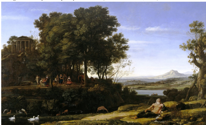
Imagen 2. Paisaje con Apolo y las musas (Claude Lorraine, 1652)