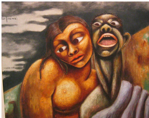
Imagen 4. Desesperanza (Max Jiménez, circa 1944)