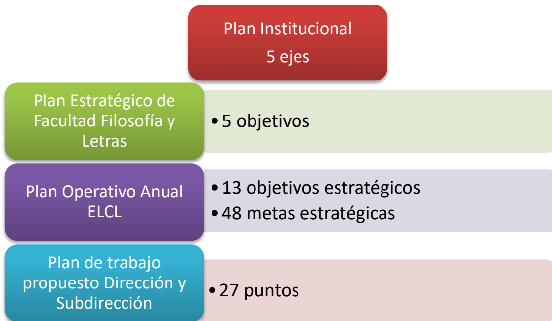
Diagrama 1. De los aspectos considerados en la elaboración de este informe