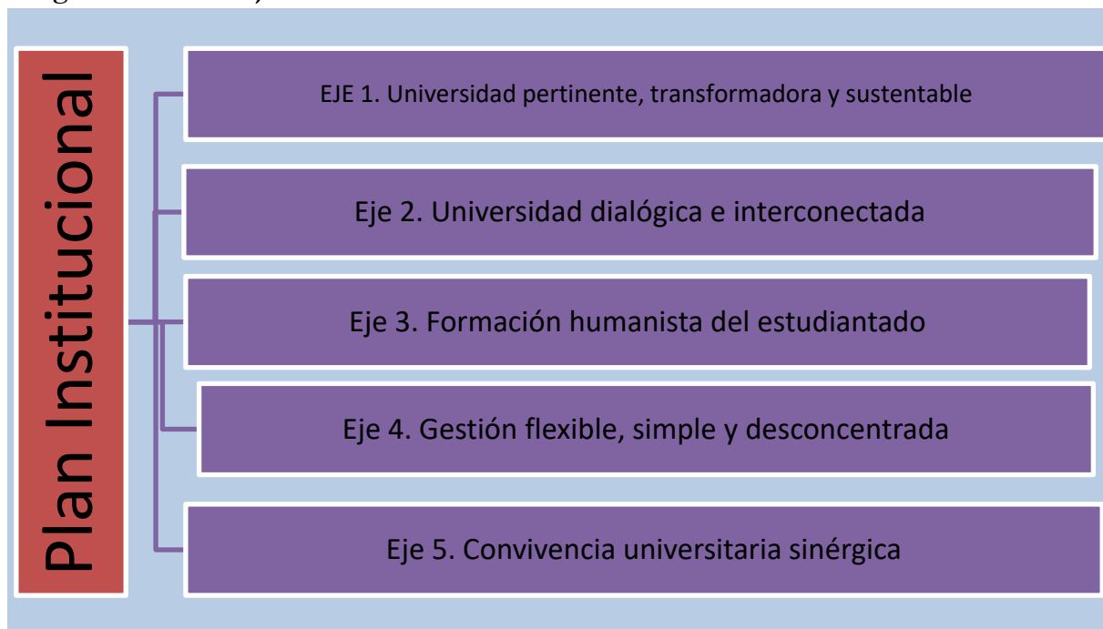
Diagrama 2. Los 5 ejes del Plan Institucional