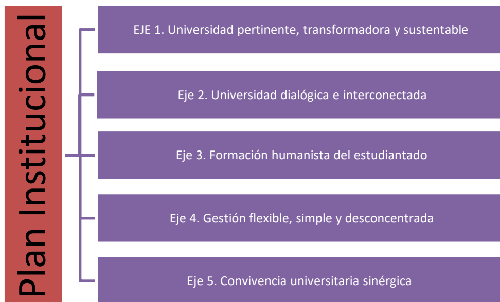
Diagrama 2. Los 5 ejes del Plan Institucional